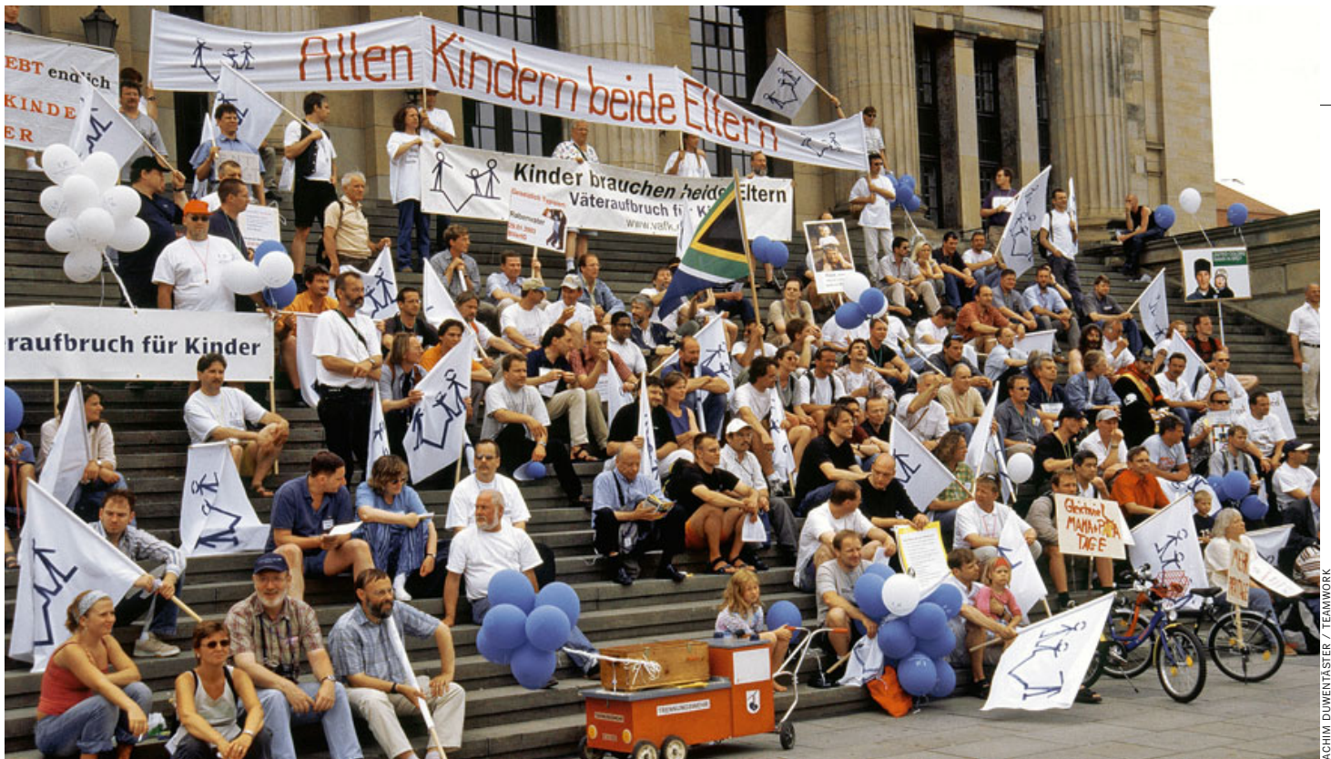
Väter-Demonstration in Berlin 2003: Das Familienrecht ist immer auch ein Schlachtfeld für den Geschlechterkampf